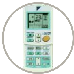
Telecomandă cu infraroșu (standard) ARC433B70

Autobaleiere pe verticală: această unitate suportă selecția autobaleierii pe verticală, care garantează distribuția uniformă a aerului și o temperatură constantă în cameră.