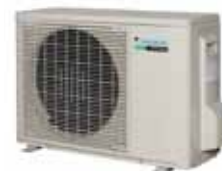
Unitate exterioară RX71GV

Prezenta broșură este doar informativă și nu reprezintă o ofertă cu caracter de obligativitate din partea Daikin Europe N.V. Daikin Europe N.V. a alcătuit conținutul acestei broșuri cât mai adecvat posibil. Nu se oferă niciun fel de garanție, explicită sau implicită, cu privire la completitudinea, acuratețea, gradul de încredere sau adecvarea pentru un anumit scop a conținutului broșurii sau a produselor și serviciilor prezentate aici. Specificațiile pot fi modificate fără o notificare prealabilă. Daikin Europe N.V. respinge explicit orice răspundere legală pentru orice pierderi directe sau indirecte, în cel mai larg sens, ca rezultat al utilizării sau în legătură cu utilizarea și/sau interpretarea acestei broșuri. Întregul conținut cade sub incidența drepturilor de autor ale Daikin Europe N.V.